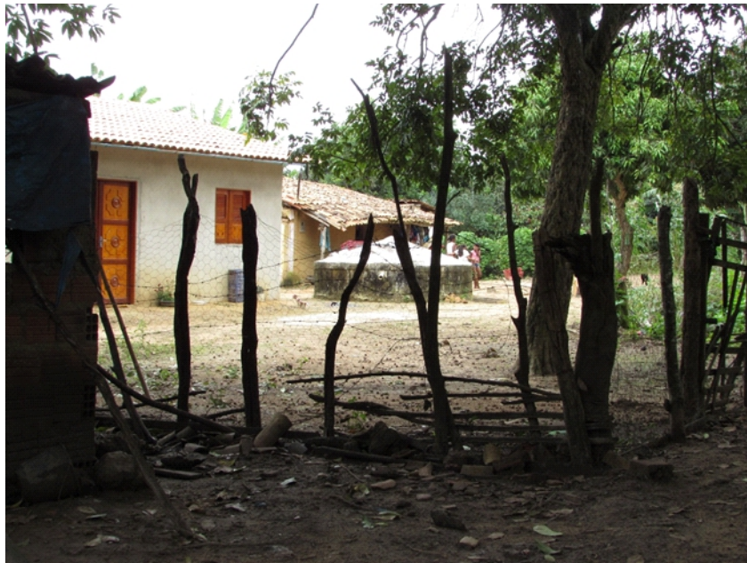
Fotografia 2 – Cisterna de placas de cimento