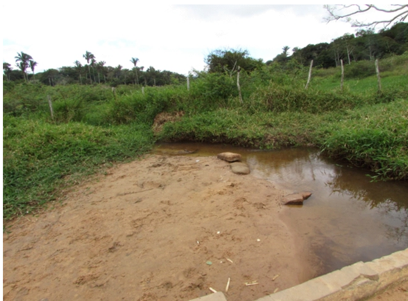
Fotografia 1 – Rio dos Grilos