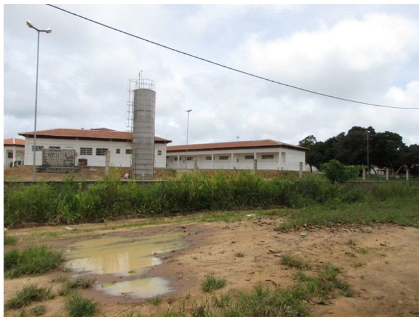
Fotografia 3 – Caixa de água da Escola Indígena Francisco Gonçalves de Sousa