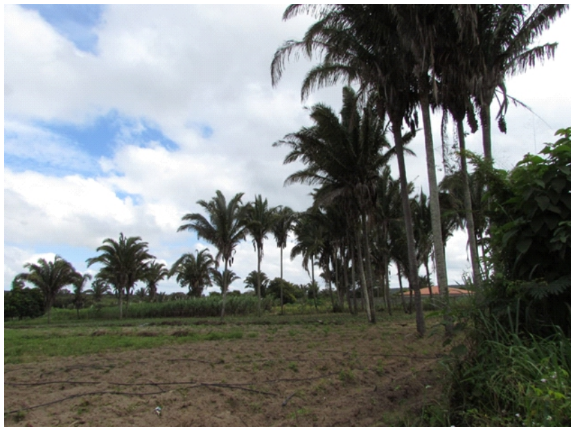
Fotografia 4 – Mangueiras de borracha em plantação de 'posseiro'