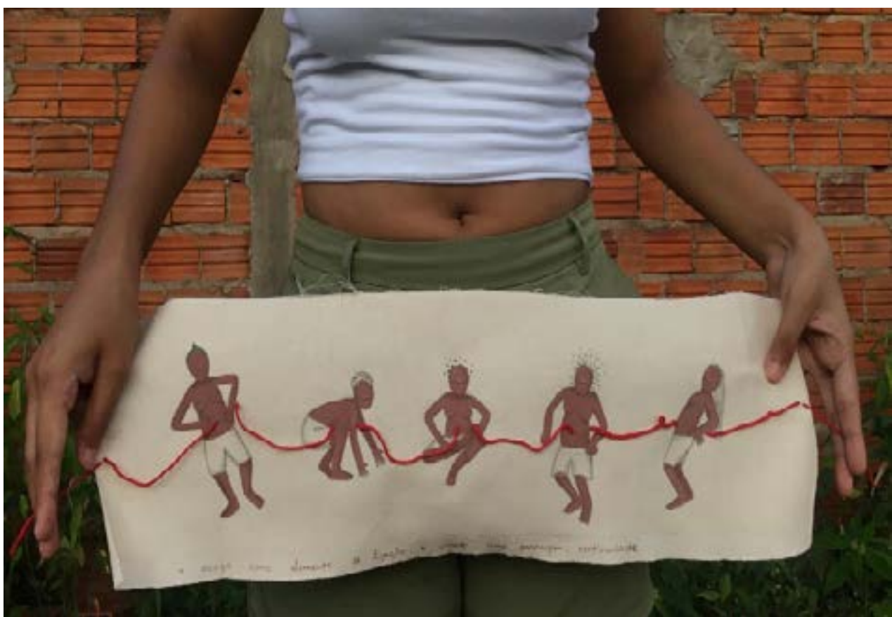
"A dança como elemento de ligação. O umbigo como passagem. Continuidade"