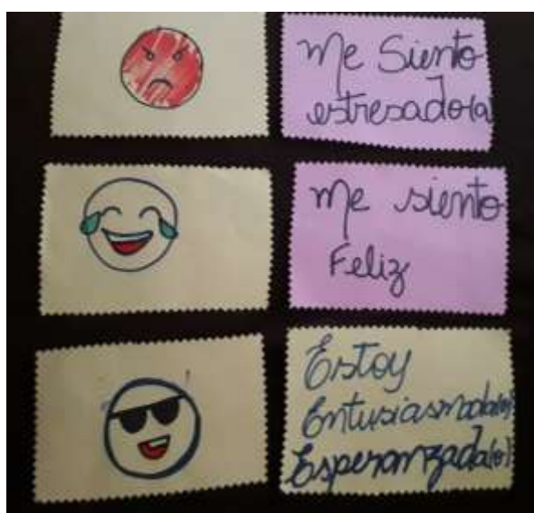
Figura 3 - Exemplos de Atividade – Tarjetas Flashes

2ª Ação - No segundo momento haverá 10 minutos de inserção de conteúdo, sendo qual for o conteúdo aplicado pelo professor a sugestão é que hajam explicações simples e que a abordagem seja visual, oral e escrita. Prática simples de ensinar qualquer vocabulário ou classe de palavras em espanhol por meio de Tarjetas Flashes.