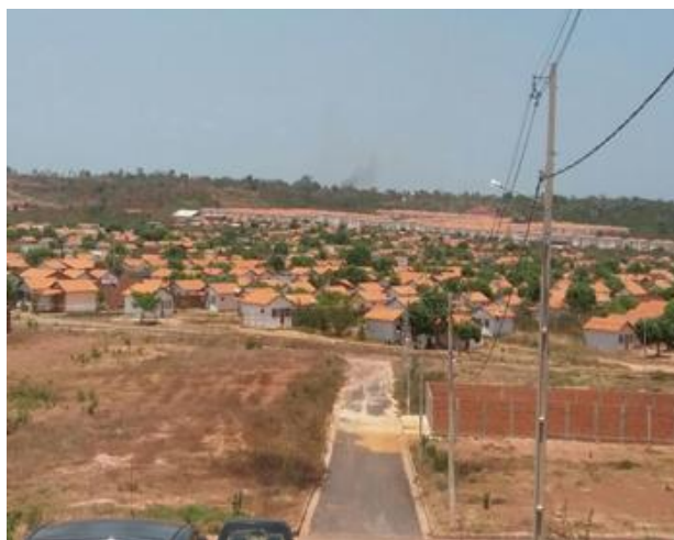
Figura 2 – Unidades Habitacionais do Sigfredo Pacheco II

As unidades habitacionais são inúmeras e apenas para ilustrar um dos diversos conjuntos habitacionais presentes em Teresina, a Figura 2 exhibe algumas casas construídas no extremo da zona Leste da cidade.