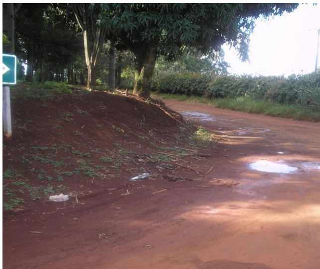
Figura 03 - Estrada São Rafael em 2007, antes da pavimentação

propriedades que trabalham com o turismo no espaço rural, assim como outros atrativos turísticos.