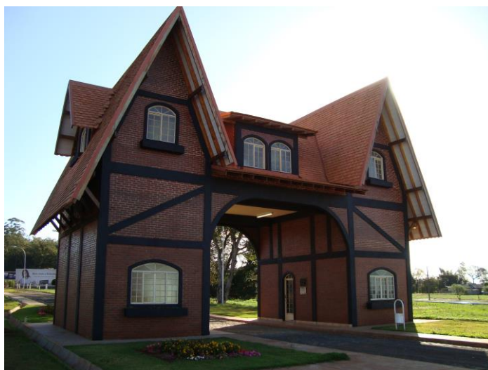
Figura 12 – Portal turístico de Rolândia “Oswald Nixdorf”