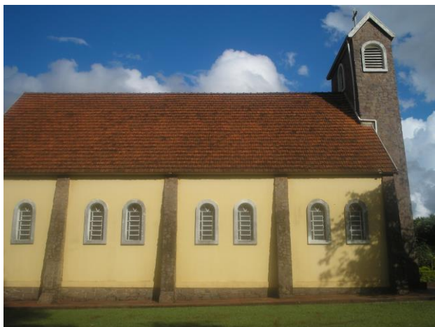
Figura 07 – Fachada lateral da Igreja São Rafael