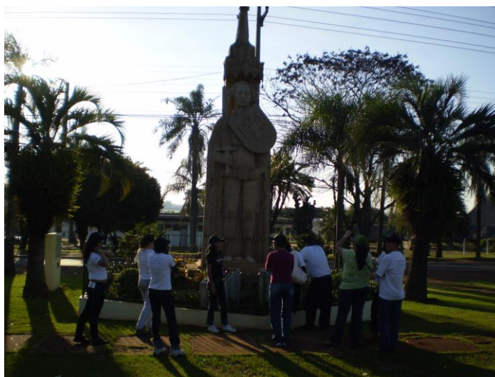
Figura 09 – Estátua Roland