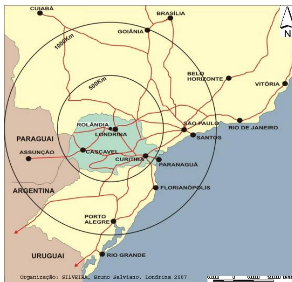
Figura 01 – Localização de Rolândia no sul do Brasil