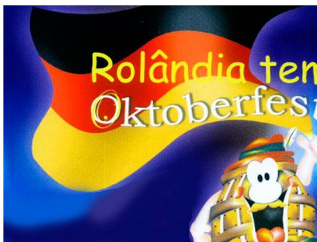
Figura 10 – Slogan e Logotipo da Oktoberfest

Um atrativo cultural famoso era a Oktoberfest, festa alemã realizada sempre no mês de outubro. Ela foi por muito tempo um dos atrativos turísticos que mais trouxe turistas e excursionistas para o município, porém, no decorrer dos anos foi se descaracterizando da tradição germânica. Envolvida em denúncias de mau uso do dinheiro público e após um período de má gestão, a festa em 2013 não aconteceu e para 2014 não se pensa em sua realização. Na Figura 06, observa-se o slogan e logotipo da festa e na Figura 10, os visitantes na área externa.