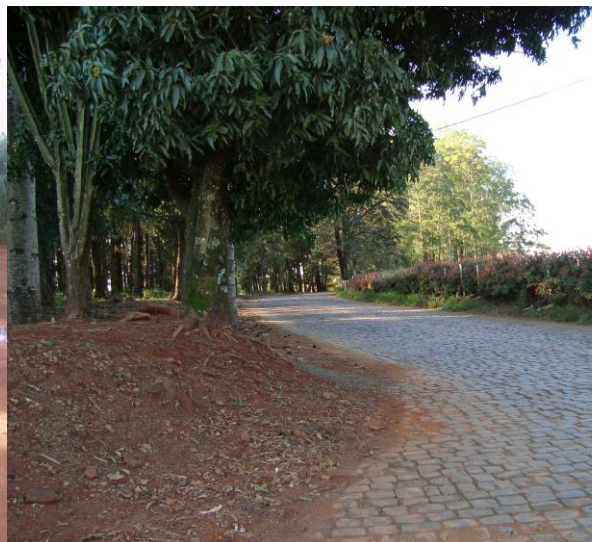
Figura 04 – Estrada São Rafael em 2008 após pavimentação