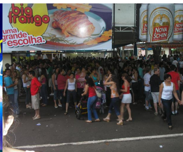
Figura 11 - Área externa da Oktoberfest