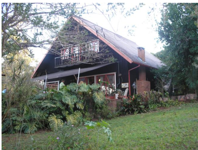
Figura 05– Pousada rural Marabú

.Fonte: o próprio autor (DOMINGOS, 2007).