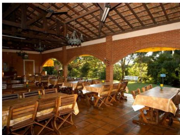
Figura 06 - Pousada das Alamandas