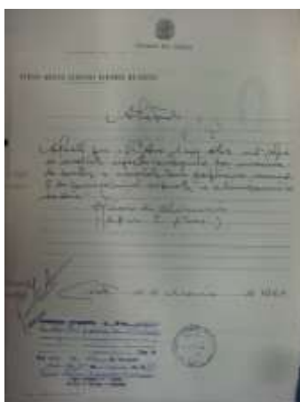
Figura 4: Atestado de Sanidade Mental de uma aluna ingressante