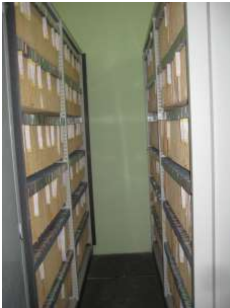
Figura 2: Armário do arquivo morto do DEG