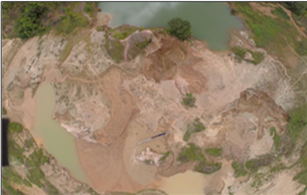
Figura 3- Deterioração ambiental e mudança da paisagem