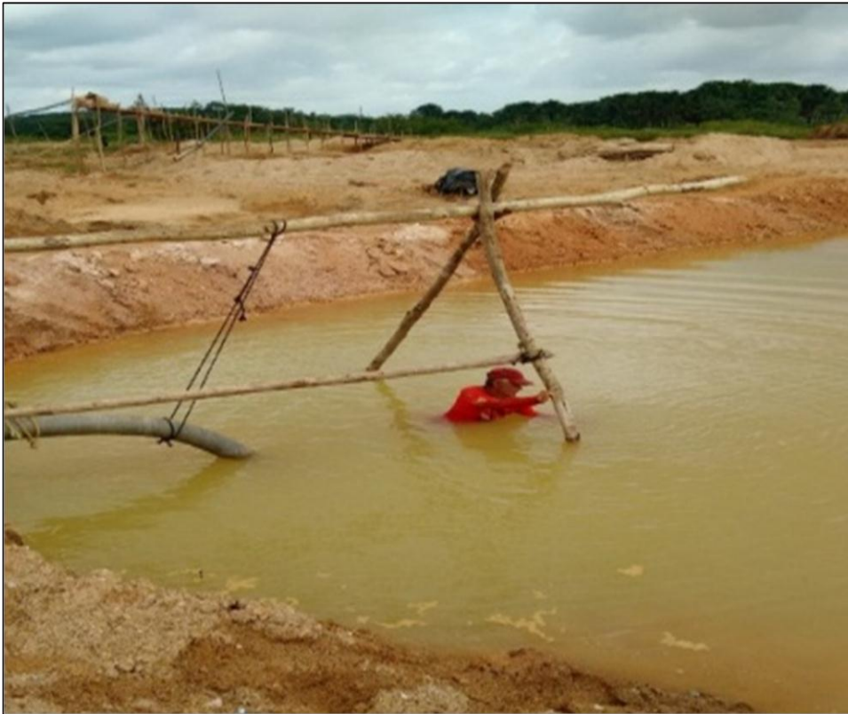
Figura 5- Trabalhador em ambiente insalubre instituído pela atividade garimpeira