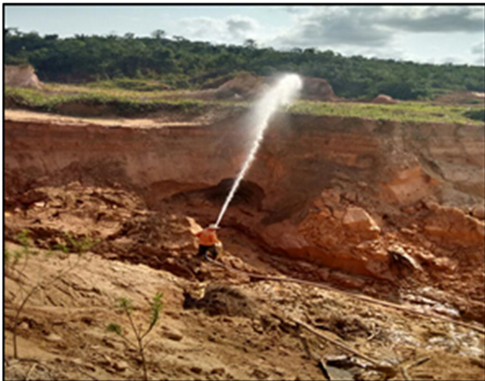
Figura 2- Atividade de garimpagem- desmoronamento de barranco