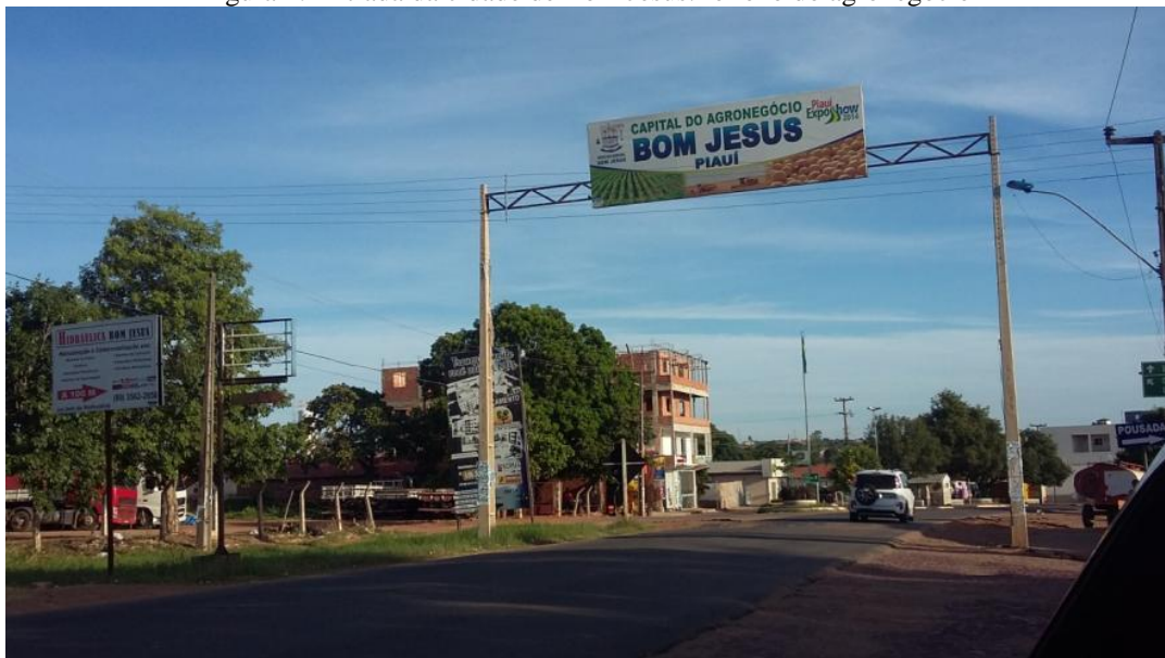
Figura 2: Entrada da cidade de Bom Jesus: reflexo do agronegócio

No entanto, em termos populacionais, os municípios da porção Sudoeste do Piauí apresentam populações reduzidas em comparação à porção norte do estado, onde se localizam as principais cidades: Teresina, Parnaíba e Picos. Além disso, o conjunto de cidades da totalidade da área de estudo é marcado pela grande quantidade de municípios onde a maioria da população ainda reside na zona rural (RUFO; ARAÚJO SOBRINHO, 2015). Nesse caso, Bom Jesus e Uruçuí assumem com destaque o papel de cidades do agronegócio piauiense, título defendido pela primeira cidade, como pode ser observado na figura 2: