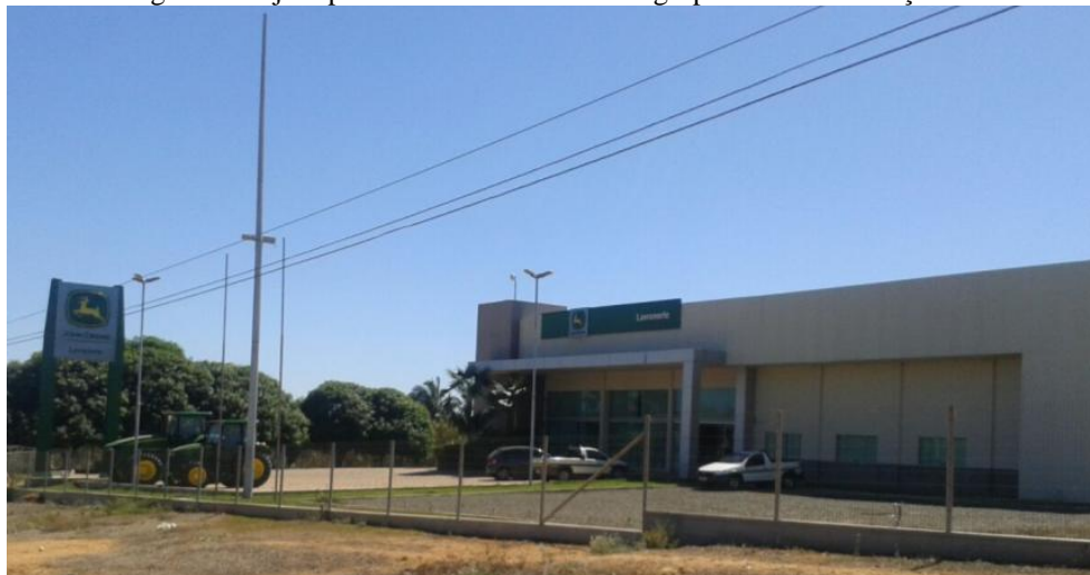
Figura 5: Loja especializada em atividades agropecuárias em Uruçuí-PI

Dentre as novas dinâmicas emergentes nas cidades do agronegócio piauiense, pode-se destacar a instalação de novas empresas, especialmente as associadas ao agronegócio, e para atendimento da demanda desse setor – maquinários agrícolas, de defensivos, fertilizantes e consultoria agrícola, como se pode observar na figura 5: