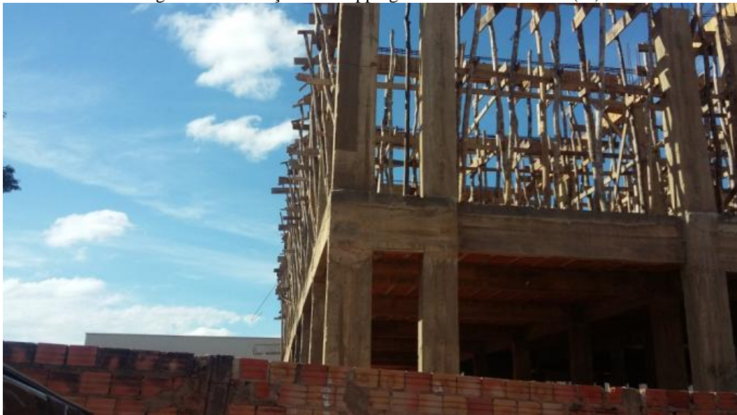
Figura 4: Construção de Shopping Center em Bom Jesus (PI)

Bom Jesus e Uruçuí possuem respectivamente 705 e 600 empresas atuantes, enquanto municípios como Gilbués e Monte Alegre, possuem, respectivamente, apenas 120 e 67 empresas atuantes (IBGE, 2010). Nesse caso, Bom Jesus e Uruçuí tornam-se centros de atração de mão de obra, além de trabalhadores e comerciantes que migram do campo para a cidade ou até mesmo de outros estados. Em relação ao quantitativo de empregados assalariados nos municípios da área de estudo, novamente ganha destaque a composição da população empregada em Uruçuí e Bom Jesus, que possuem, respectivamente, 3.409 e 2.457 trabalhadores assalariados 3 , número bem superior ao padrão dos outros municípios da área de estudo, com exceção de Corrente, que possui 1.395 trabalhadores ocupados. Bom Jesus é, ainda, a cidade com o maior percentual de ocupados no setor de construção civil (10,31%), inclusive pode-se observar a presença de muitos empreendimentos em construção motivados pela expansão do comércio e crescimento da economia local, como se pode observar na figura 4: