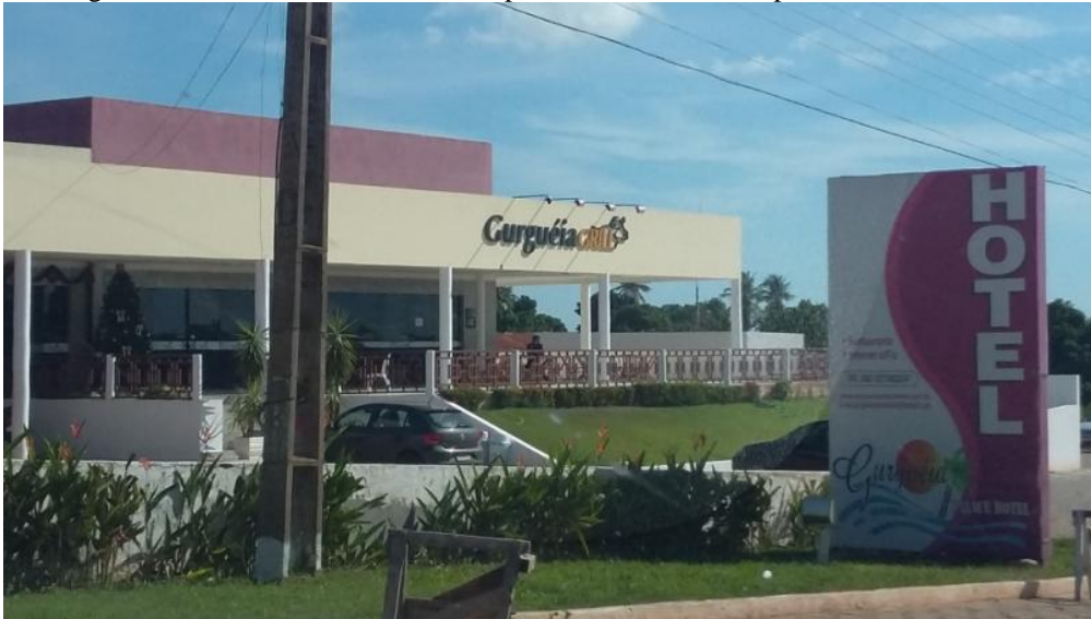
Figura 3: Churrascaria e hotel de alto padrão em Bom Jesus, próximo à BR-135-PI.