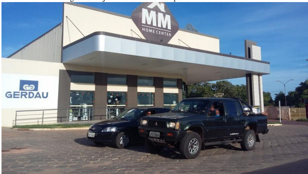
Figura 6: Loja vinculada à construção civil em Bom Jesus

Em conjunto com as modificações demográficas e na economia urbana dessas cidades, verificou-se, em trabalhos de campo, que a cidade de Bom Jesus é a que mais se destaca em relação ao comércio e serviços diferenciados e modernos, conforme figura 6.