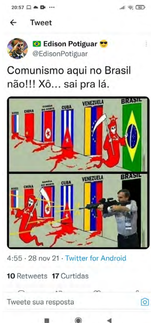
Figura 1 - Post 1