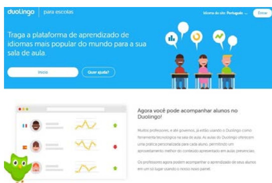
Fig.1: layout da página inicial da plataforma Duolingo para escola. Fig.2: Turmas para acompanhamento do progresso dos alunos.