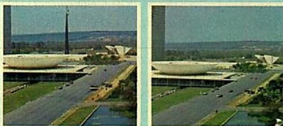
A Praça dos Três Poderes hoje e como ficaria sem o mastro

Espanha, quando o México proclamou sua independência. Colocou-se ao pé da estátua uma placa afirmando que Carlos IV e a Espanha oprimiram o México, mas que o monumento seria preservado pelo seu valor histórico. O mesmo poderia ser feito com o mastro de Brasília, em vez de se esquecer da História escondendo um dos seus marcos.